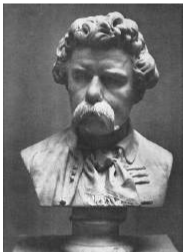
Arany János mellszobra

<img src="images/arany_janos.jpg" alt="szobor">